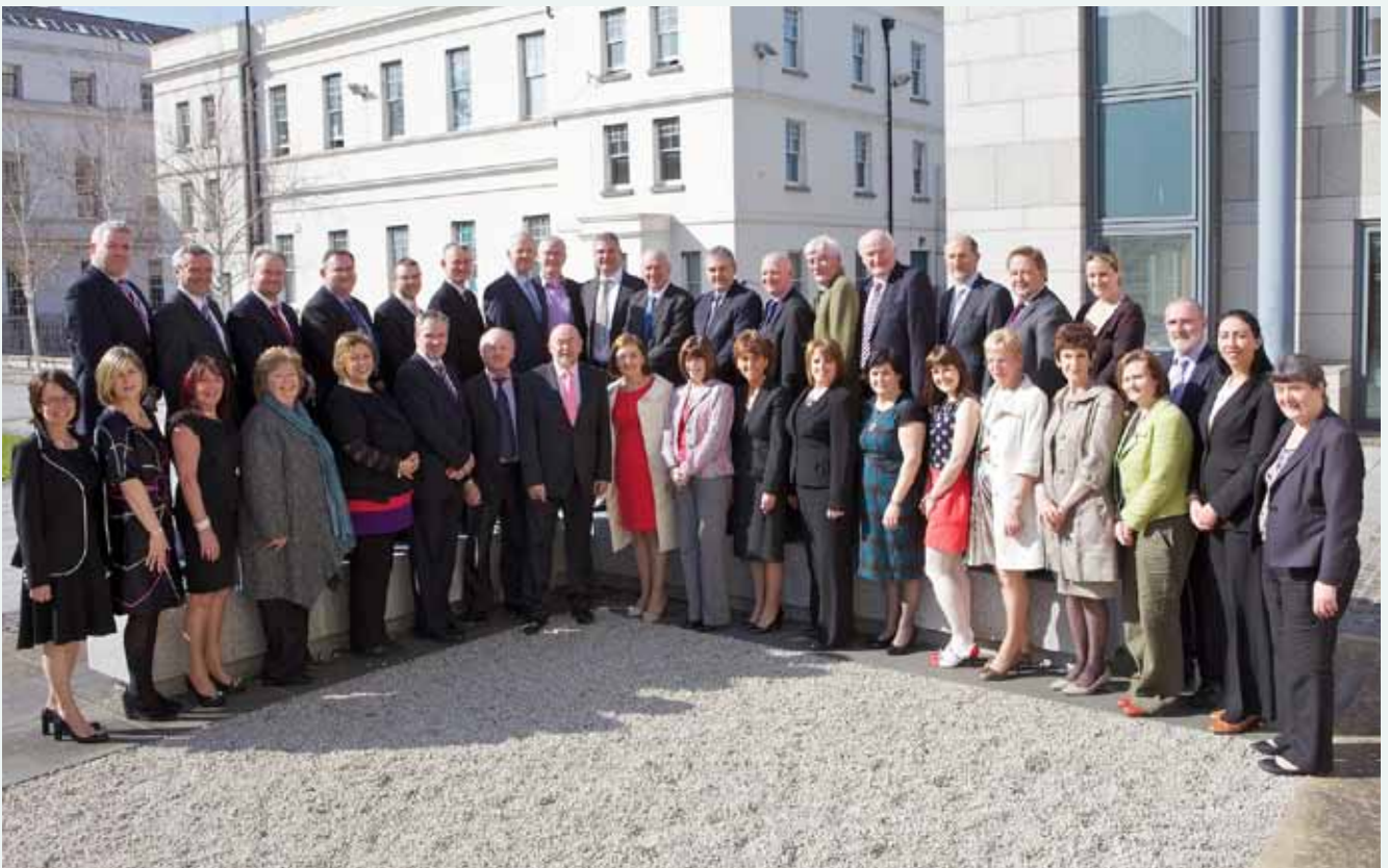
Ceapadh an tríú Comhairle Mhúinteoireachta